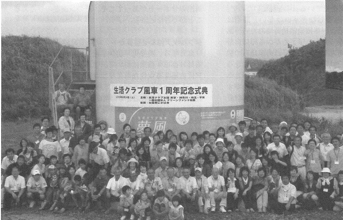
生活クラブ風車「夢風」1周年記念式典に参加した秋田県にかほ市の方々と生活クラブ生協メンバー (13頁)