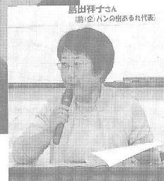
今、話題の「年金改革」をNPO大学講座でとりあげる